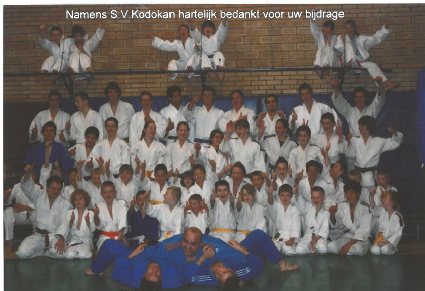
SV Kodokan geeft les in judo, aikido en zelfverdediging en is te volgen op Twitter (SVKodokan).

Namens het bestuur en organisatiecommissie van S.V. Kodokan,