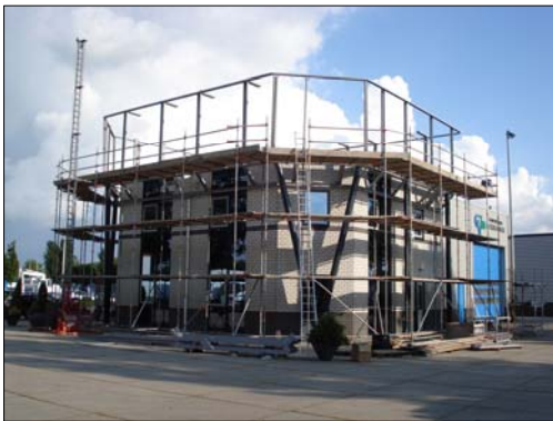
Links: De eerste contouren Worden zichtbaar