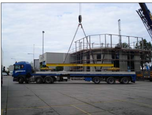
Rechtsboven: Hier wordt het eerste vloerdeel geplaatst