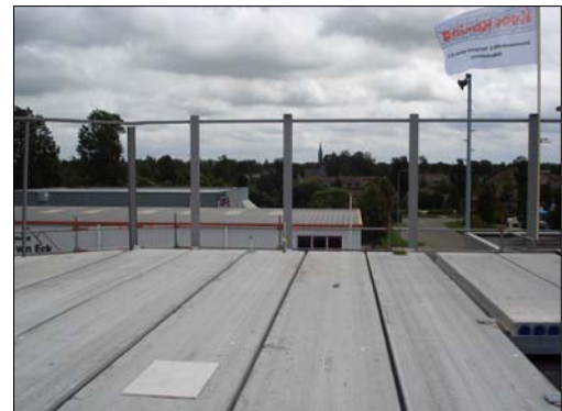
Rechtsonder: En de "skyline" van de Beemster is zichtbaar...